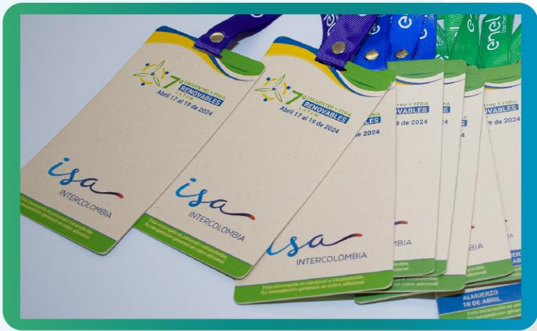
Logo en escarapela de identificación - (exclusivo)