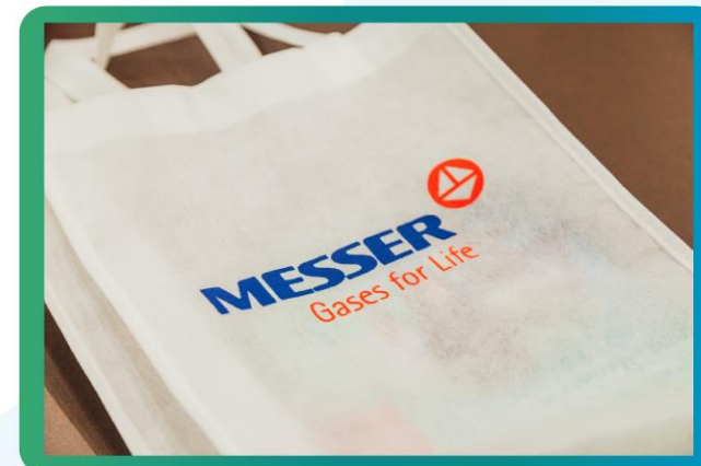
Logo a dos tintas en bolsos para los asistentes - (exclusivo)