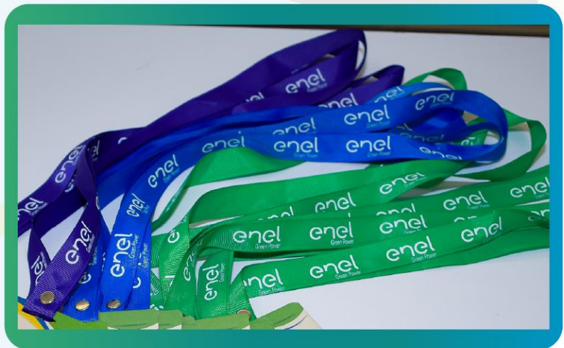
Logo a una tinta en la cinta de las escarapelas - (exclusivo)